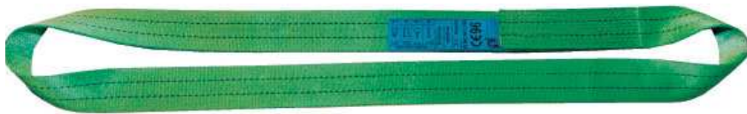
ΙΜΑΝΤΑΣ ΑΤΕΡΜΩΝ ENDLESS